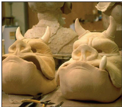
Máscaras de látex sobre la mesa de trabajo del taller de criaturas. A la espera de ser convertidas en el húmedo rostro de unos guardias gamorreanos.

Tippet trabaja en el modelado de uno de los personajes más queridos de la Alianza Rebelde, el célebre Almirante Ackbar de la especie mon calamari.